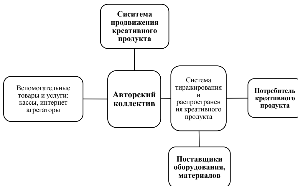
Рисунок 2 – Сетевая модель функционирования креативных индустрий

экономическими мотивами. Возможность творческой самореализации, формирования нового продукта, получение нового знания может превалировать над экономическими эффектами в рамках креативной сети.