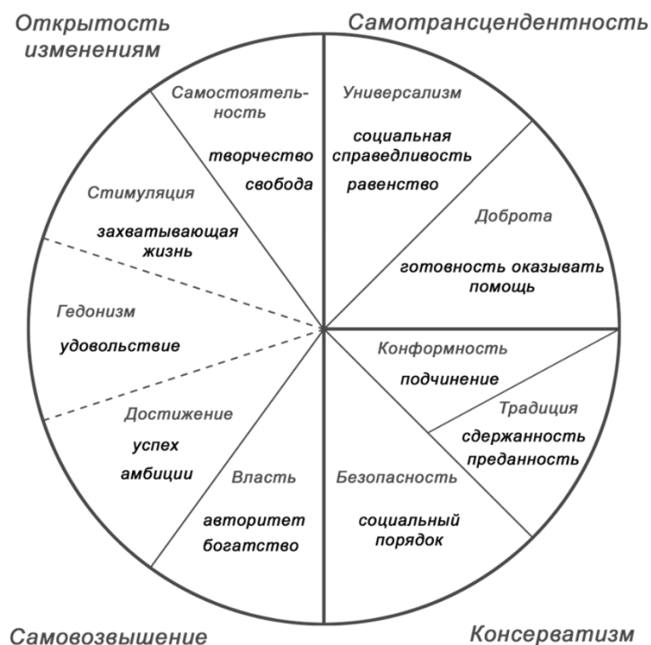
Рисунок 2 - Круг ценностей Ш. Шварца [9]

играют также: родовые признаки, жизненный опыт, социальный статус, уровень духовного развития, сознания, межличностных связей человека и так далее.