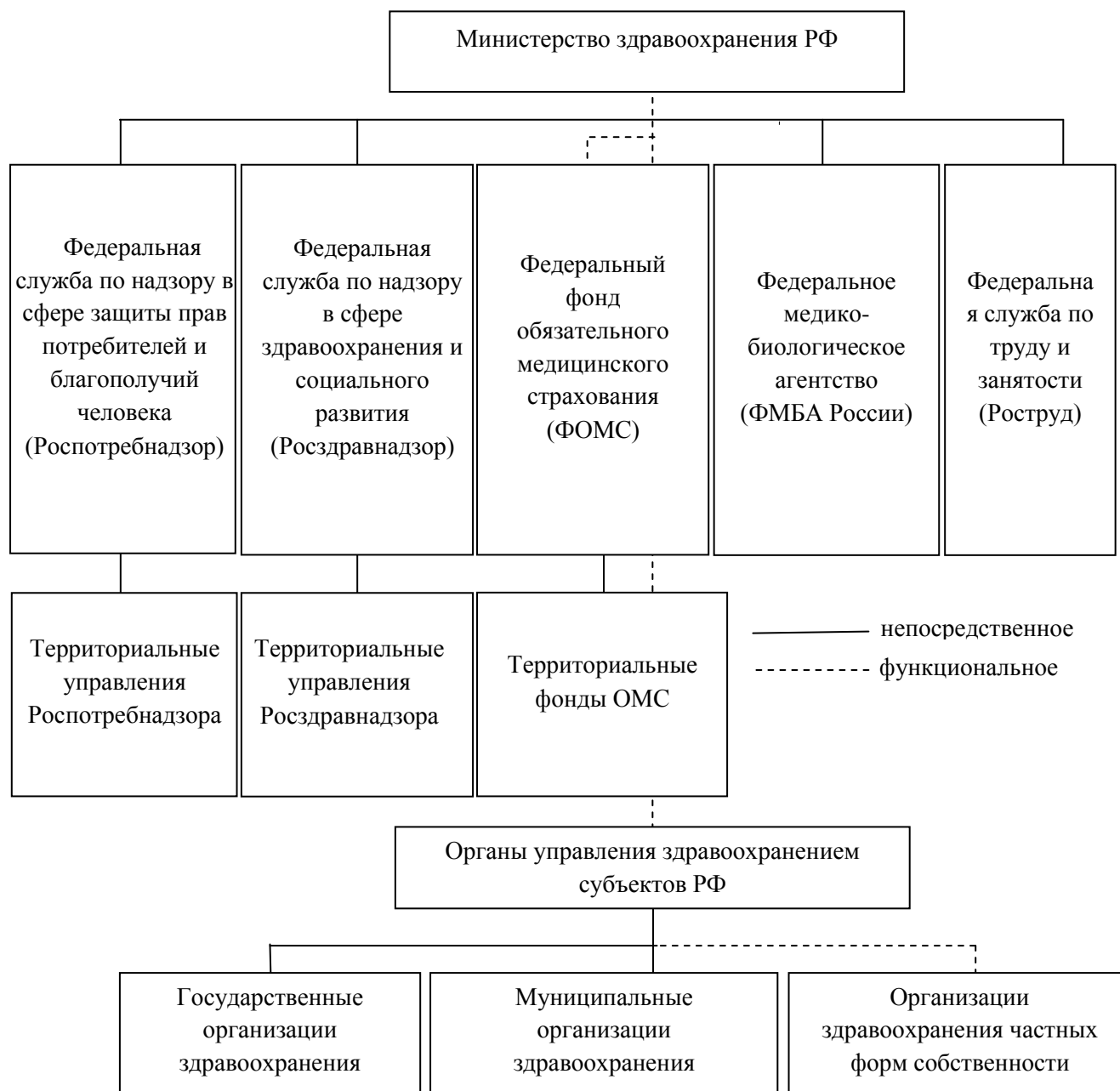
Рисунок 2 – Система управления здравоохранением в России

На рисунке 2 представлены органы управления здравоохранением.