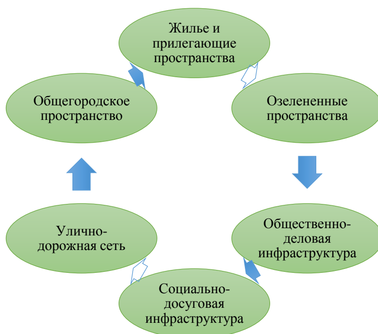
Рисунок 2 - Индикаторы оценки комфортности городской среды

В рамках проекта Минстрой проводит оценку комфортности городской территории, используя Индекс качества городской среды. На рисунке 2 указаны индикаторы, по которым происходит оценка городского пространства.