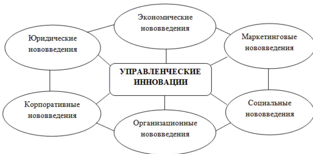
Рис. 1. – Виды управленческих инноваций в зависимости от сферы их внедрения [5]

Управленческие инновации могут касаться разных сфер деятельности предприятия – это организационная структура, система управления, экономическая деятельность, юридическое обслуживание, маркетинговая политика и др. Виды управленческих инноваций в зависимости от сферы их внедрения представлены на рисунке 1.